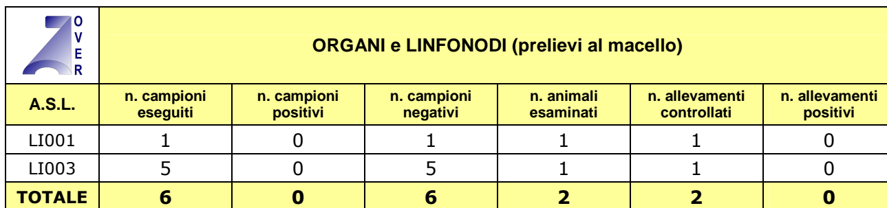
Tabella 2: esami batteriologici effettuati su organi e linfonodi di bovini abbattuti per la ricerca di Brucella spp.- anno 2011.